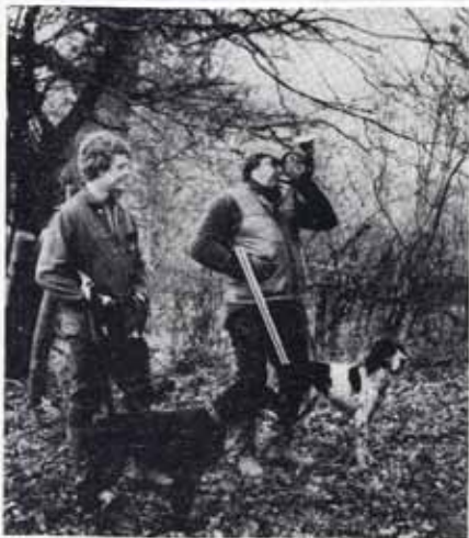
På kursus lærer du også at blæse jagtsignalerne.

Jagthornsblæsning kan læres af enhver! - Kunne du også tænke dig at få startet rigtigt, så meld dig til vort kursus, som begynder mandag den 30. september.