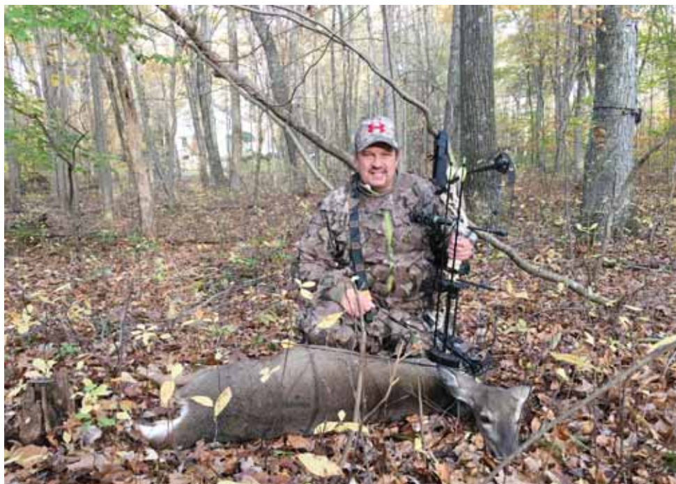
Med whitetail og compoundbue

Da den stod under mig, kunne jeg høre den prøvede at besvare mit kald. En meget spændende oplevelse.