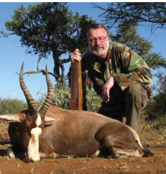
Blesbock i bushen

Fra toppen af klipperne overskuede vi området. Vi så ørne svæve over vore hoveder. Min PH og farmeren må have sat pris på mig, for jeg fik at vide, at hvis jeg faldt ned fra