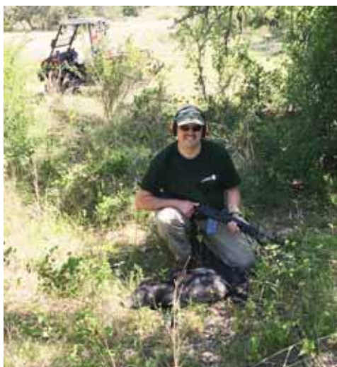
Med det første svin og M1 Carabin

Jeg måtte skynde mig at få licens til jagt med skydevåben i Texas online, men det var ikke noget problem, da jeg allerede havde