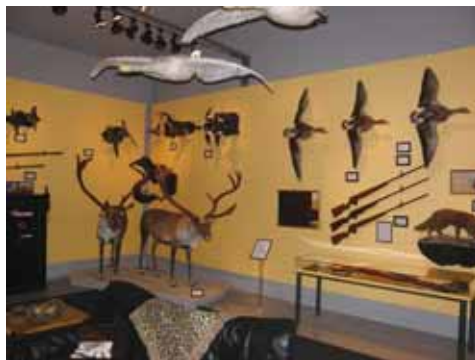
Hunting Museums trofæudstilling. Læs mere side 12