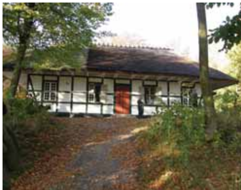
Jagthytte i Færgelinden Jægerspris