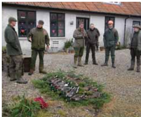
Vildt parade på Freddal efter Nyårsjagt

Forordningen med en Jagtfiskal er en ordning, der stammer helt tilbage fra Kong Christian Den Femtes Danske lov af 15-04-1683, så den har nogle år på bagen.