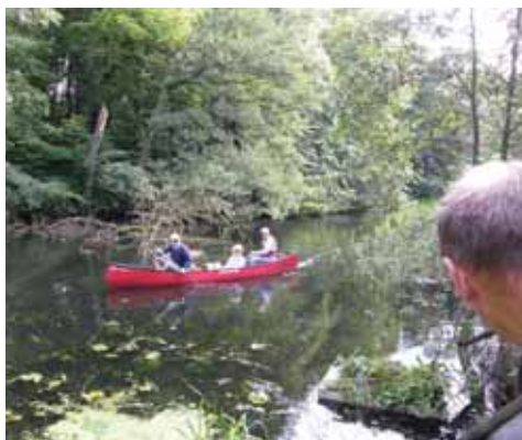
Klapfælde monteret på flydeplan og kamufleret sættes ud i Mølleåen.