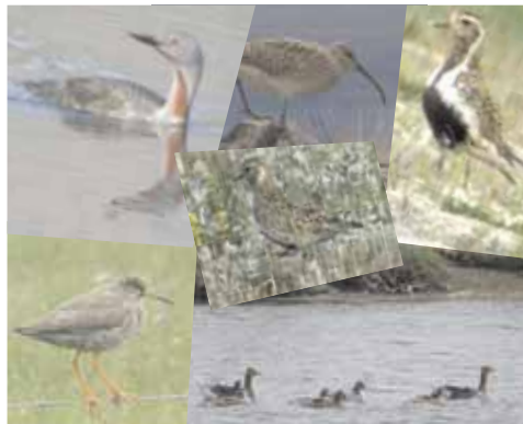
Stor Regnspurve, Rødstrubet lom, Rødben, Hjejle og svømmende gåsefamilie.

Som det fremgår af fotos, mødte vi de forskellige fugle på deres egen hjemmebane, og det blev til adskillige fuglebilleder inden vi vendte næsen hjemad efter 14 gode dage i den islandske natur.