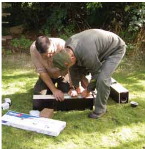
Klapfælde gøres klar til brug.