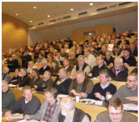
Års kredsmøde 2013 i kreds 7, på Høvelte kaserne.