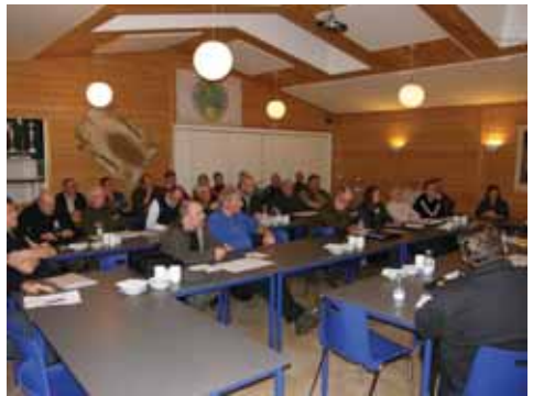
Orienteringsmøde fra 4-banden i Køge-Herfølge Jagtforening ny Kreds struktur.

Det var glædeligt for de fire mand, der havde lavet arbejdet og i periodens forløb blev døbt 4-banden.