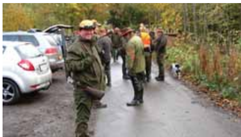
Jægerne klar til afgang mod første sät.

Jagten i Klemensker plantage har tidligere været ejet af kommunen og jagtforeningen har for beskeden betaling fået lov til at jage der. Nu er ejendommen imidlertid blevet solgt, men jagtforeningen har stadig mulighed for at jage i plantagen. Vi mødte op i god tid, men var selvfølgelig langt fra blandt de første. Der deltog over 40 mennesker i dagens jagt, det er lidt mere end jeg er vant til, men det var dejligt at møde så mange positive og rare mennesker. Den nye ejer af plantagen havde fældet ca. halvdelen af træerne og hakket dem til flis. Der var således mange åbne områder. På trods af dette blev der dog set en del vildt, primært harer og råvildt. Efter aftale med skovejeren måtte der ikke skydes bukke. Jagtlederen var meget præcis: "Den der skyder en buk betaler 500 kr. og så kommer tro-