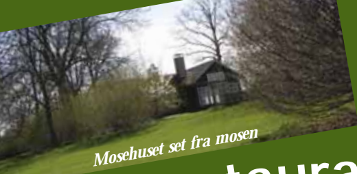
Mosehuset set fra mosen