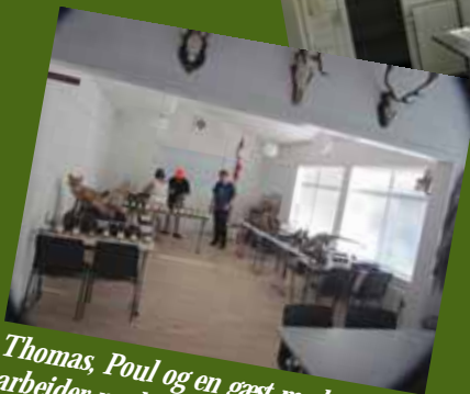
Thomas, Poul og en gæst med trofæer arbejder med trofæophængning