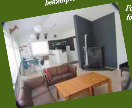
Foreningens lokaler tager form og det ses at hyggen breder sig. Tingene skrider frem, men indvielsen nærmer sig også