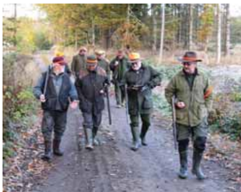
Hyggesnak mellem såterne.

Efter frokosten var der tid til endnu et par såter. Der blev set og skudt til både harer og skovsnepper. Jeg fik selv muligheden for en skovsneppe, men min indsats imponerede ikke fuglen.