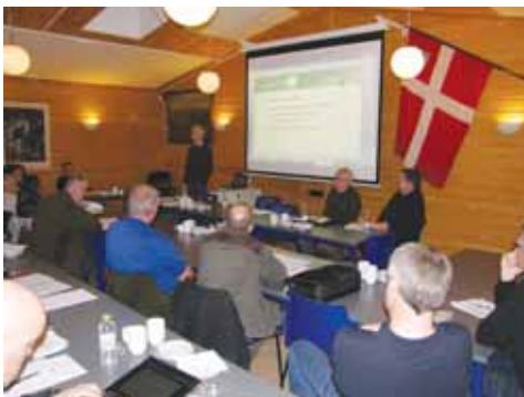
Chr. Færch orienterer forsamlingen.

Forslaget blev prøvet på flere møder og endelig vedtaget på Kredsmødet på Høvelte kaserne med et meget stort flertal.