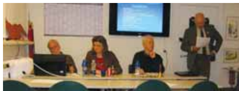
Formanden aflægger beretning, medens dirigenten og dele af bestyrelsen lytter andægtigt til.

Knivkurserne har kørt i to år og har været et kreativt arrangement; i stand til at tiltrække medlemmer vi ellers ikke ser.