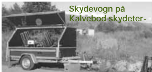
Skydevogn på Kalvebod skydeter-